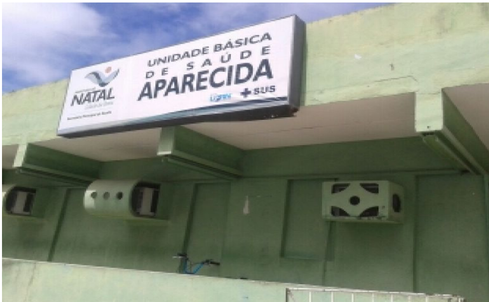
Reforma e Ampliação em andamento da UBS Aparecida