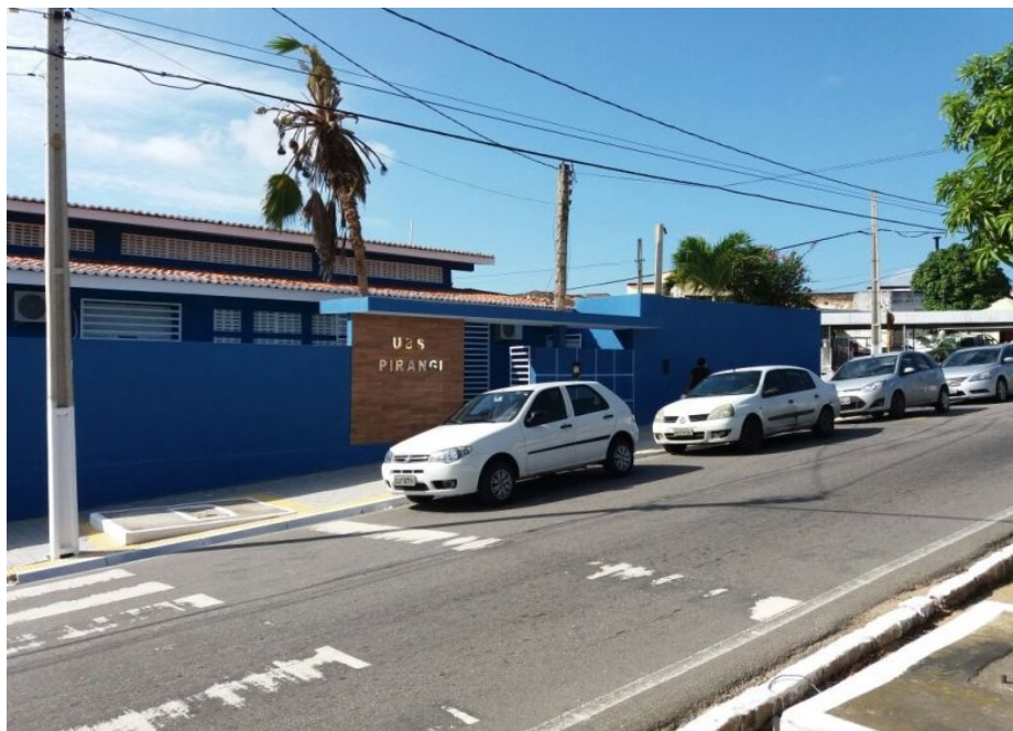
Reforma concluída da UBS Pirangi (Depois)