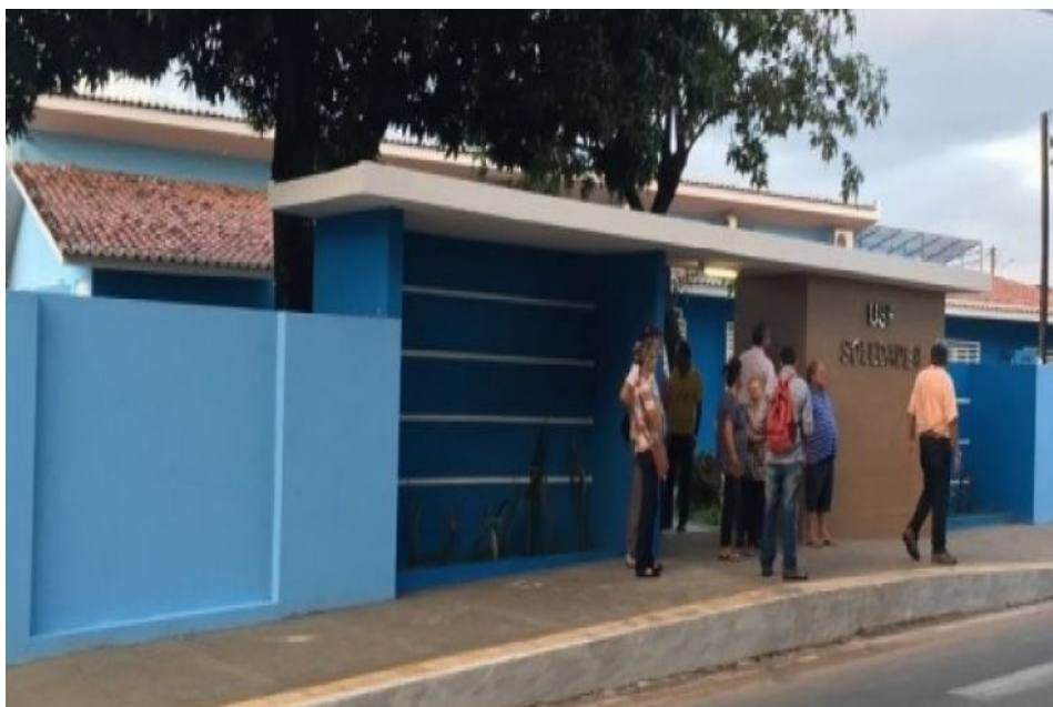
Reforma concluída da UBS Soledade II (Depois)