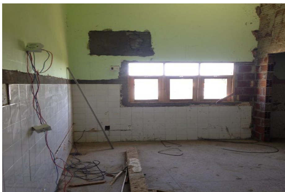
Reforma iniciada na UBS Panatis