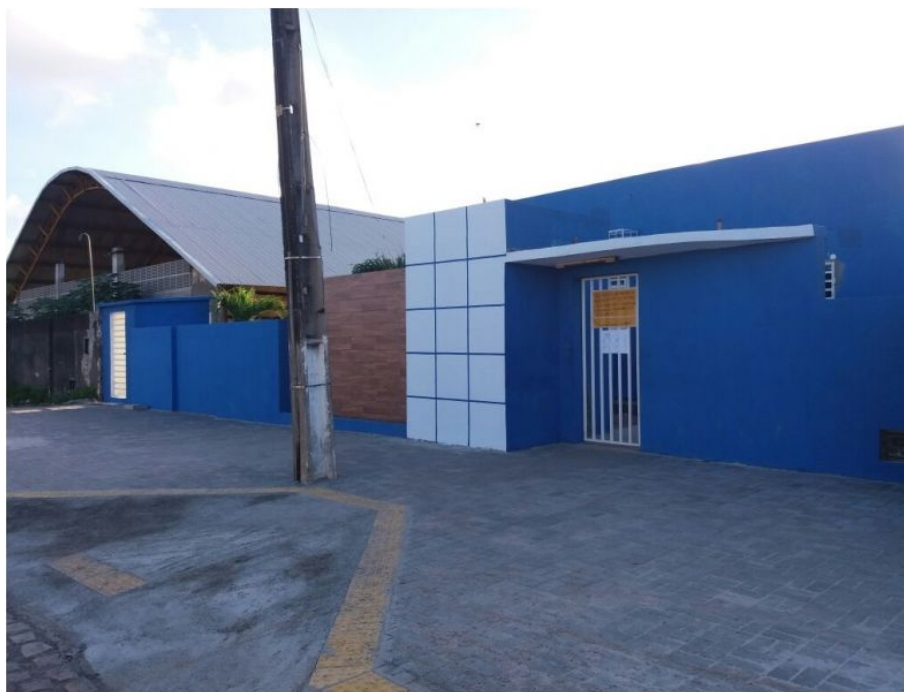
Reforma concluída da UBS Nova Natal (Depois)