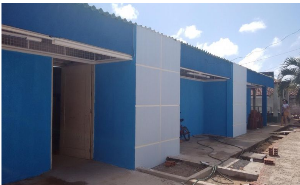
Reforma concluída da UBS Quintas (Depois)