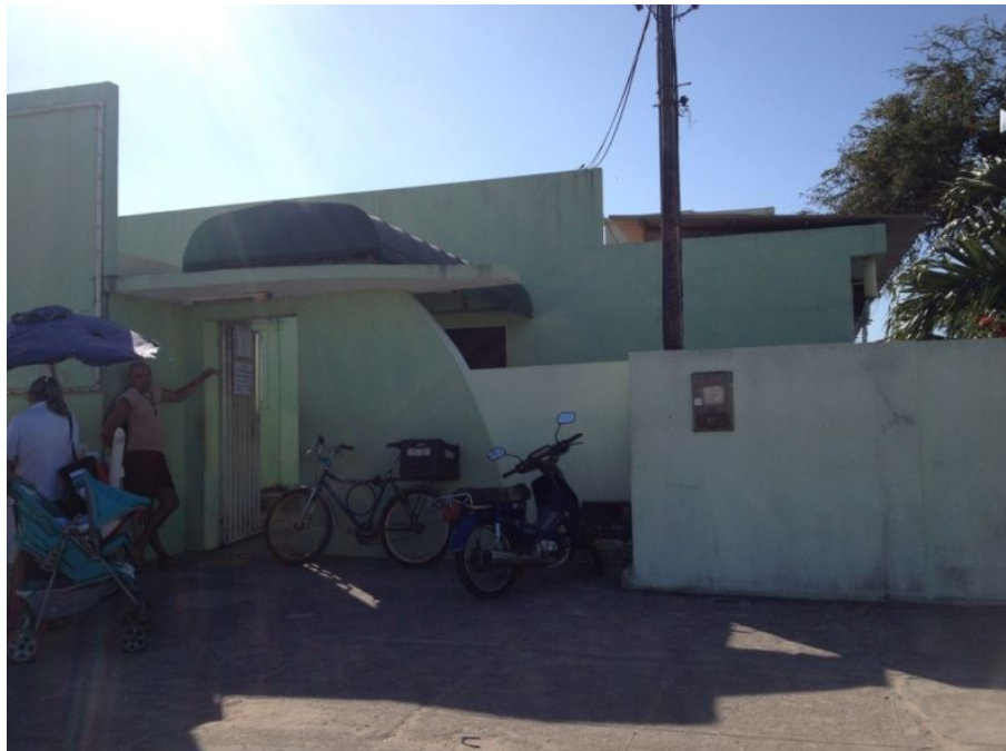
Reforma concluída da UBS Nova Natal (Antes)