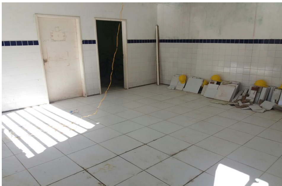
Reforma em andamento da UBS Brasília Teimosa