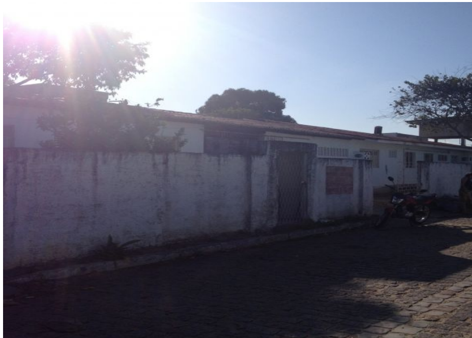
Reforma concluída da UBS Soledade II (Antes)