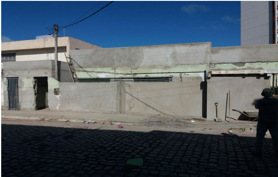
Reforma em andamento da UBS Brasília Teimosa