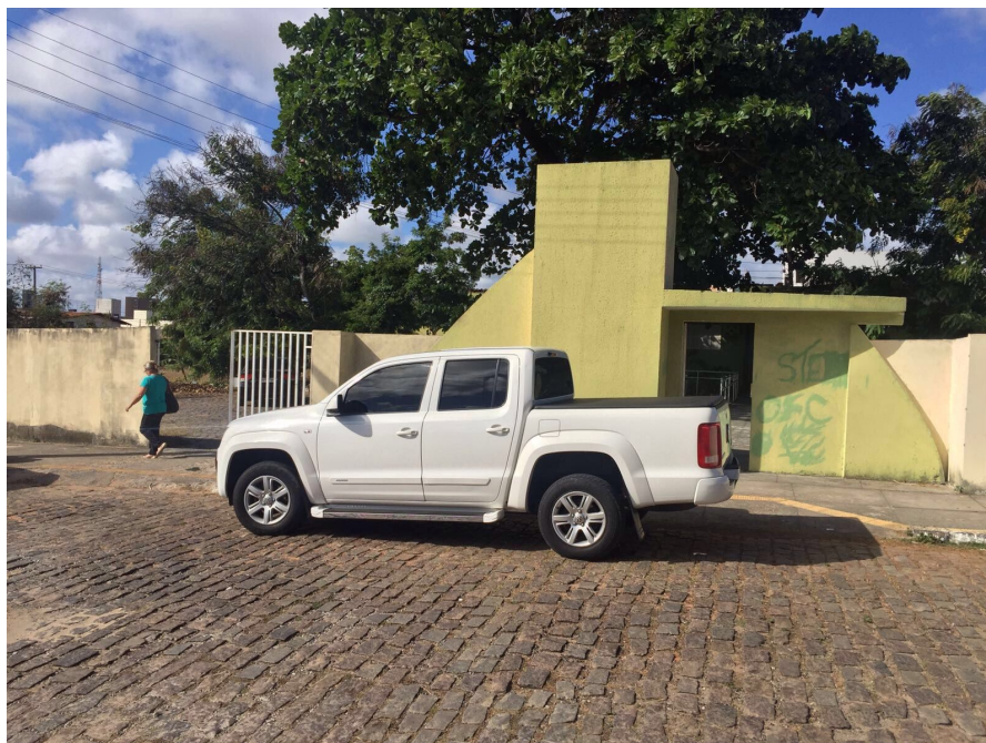
Reforma concluída da UBS Candelária (Antes)