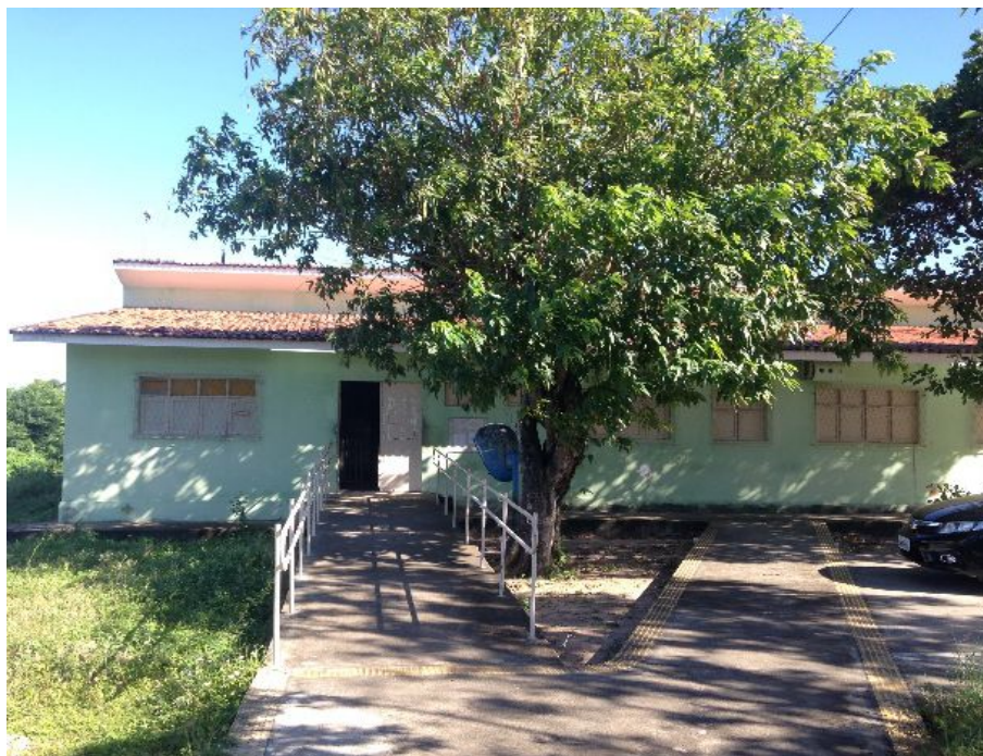
Reforma iniciada na UBS Panatis