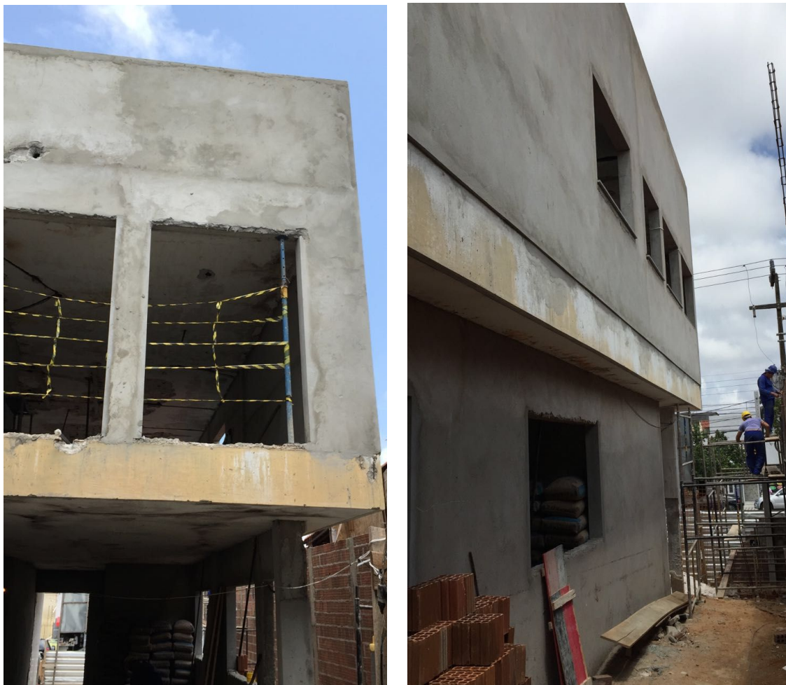
Reforma iniciada no CEREST Regional de Natal