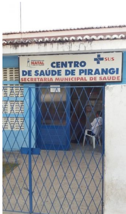
Reforma concluída da UBS Pirangi (Antes)