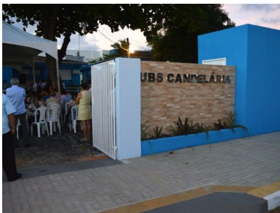
Reforma concluída da UBS Candelária (Depois)