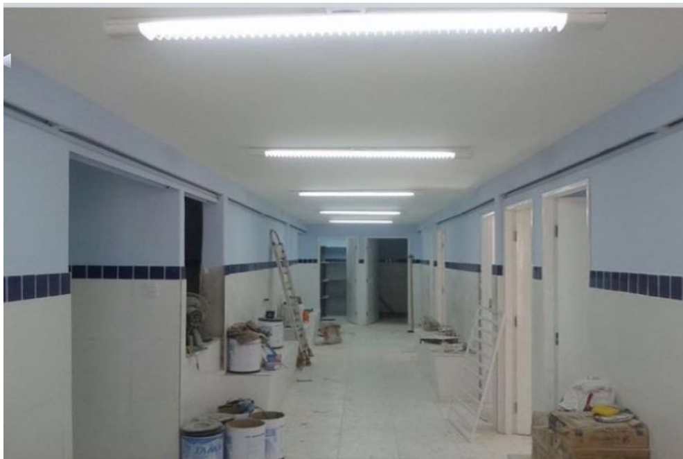
Reforma e Ampliação em andamento da UBS Aparecida