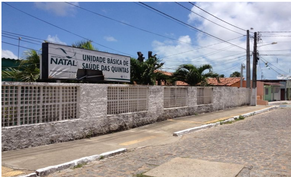
Reforma concluída da UBS Quintas (Antes)