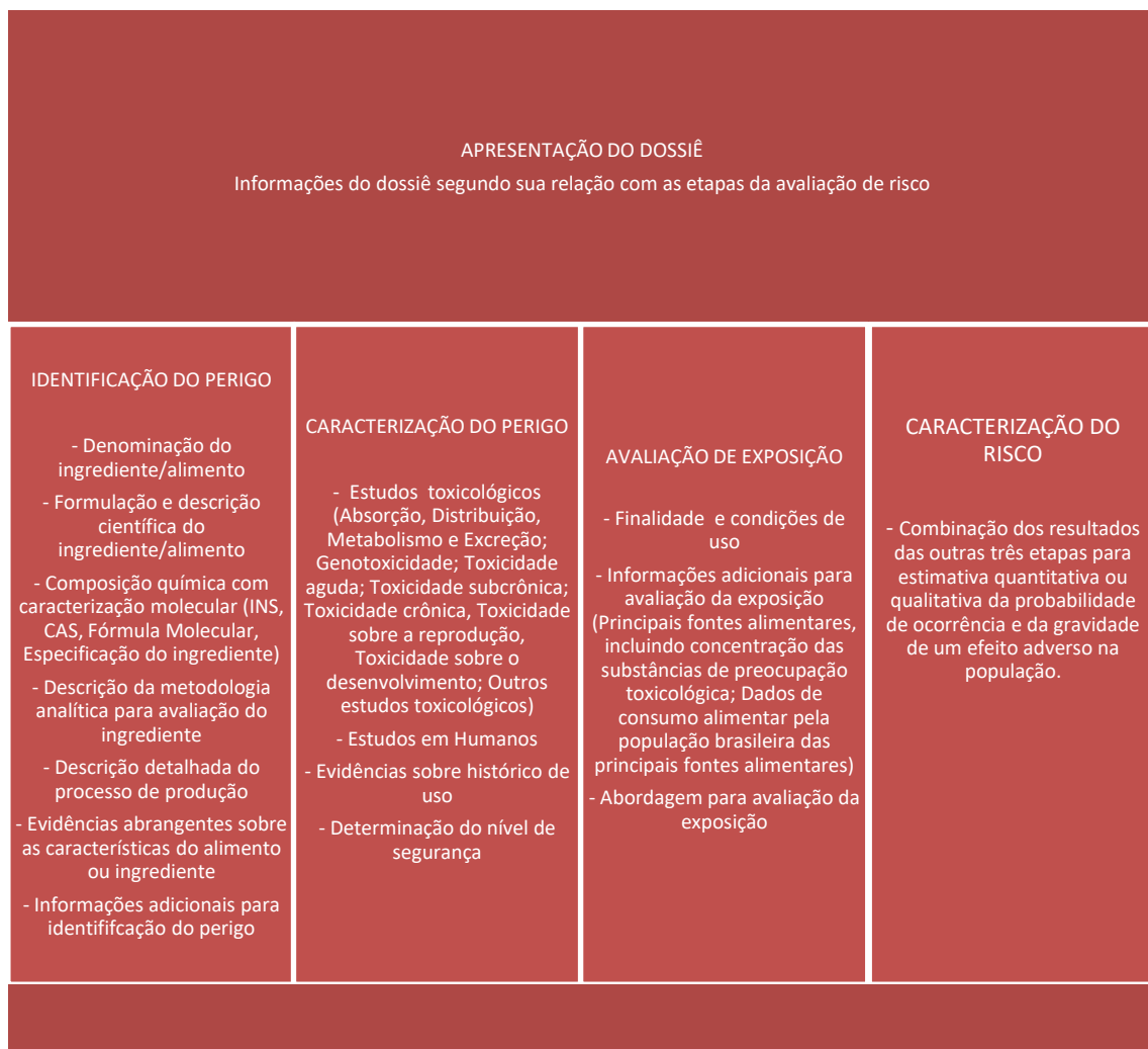
Figura 1 – Componentes do dossiê técnico-científico para avaliação de segurança de uso de um alimento ou ingrediente alimentar.

O dossiê deve ser elaborado com redação objetiva e clara, não devendo possuir conteúdo alheio ao processo de comprovação de segurança de uso. As informações devem estar respaldadas em dados técnicos e científicos, de qualidade reconhecida. As referências técnico-científicas citadas no relatório devem ser apresentadas em sua