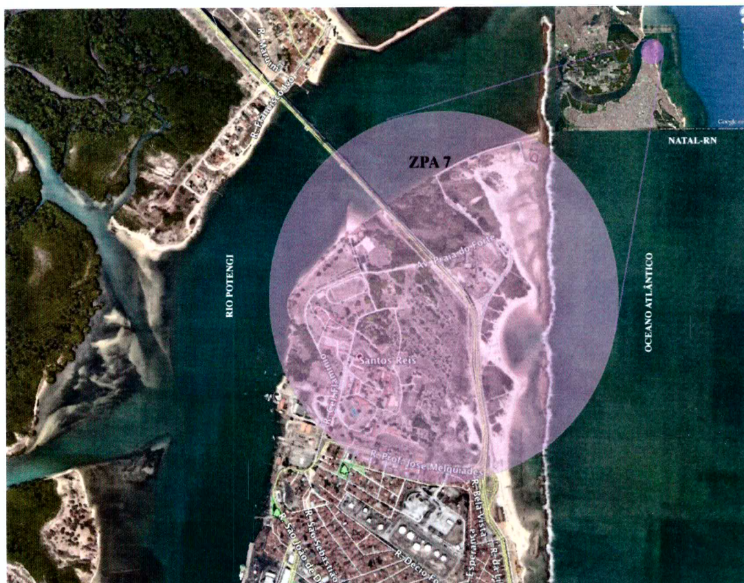
Mapa da ZPA 7 na cidade

As Zonas de Proteção Ambiental de Natal foram instituídas pelo Plano Diretor de 1994 (Lei Complementar 7/94) e reafirmadas no Plano Diretor de 2007 (Lei Complementar 82/07) como integrantes do macrozoneamento que orienta o processo de ocupação do solo do município. A Zona de Proteção Ambiental (ZPA) foi definida no Art. 17 como “a área na qual as características do meio físico restringem o uso e ocupação, visando a proteção, manutenção e recuperação dos aspectos ambientais, ecológicos, paisagísticos, históricos, arqueológicos, turísticos, culturais, arquitetônicos e científicos”.